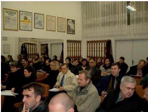
a) Skupština u Lukavcu

Sušтина ove aktivnosti sadrži se u tome da je osoblje CCIa proteklih mjeseci pozivano na sjednice skupština (uz manje probleme) uz dostavljanje radnih materijala za konkretnu sjednicu kojima je, po tom, osoblje CCI-a i prisustvovalo u formi posmatrača bez prava glasa.