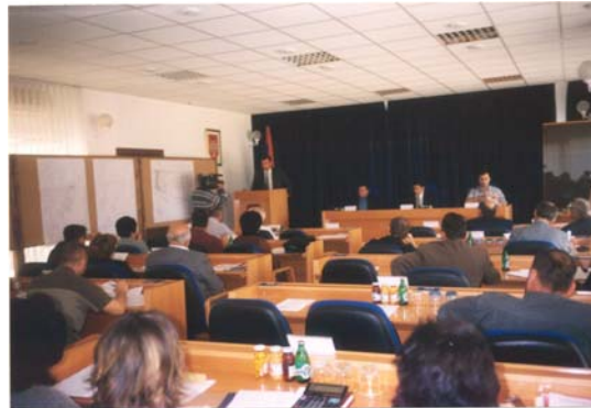
b) Skupština u Laktašima