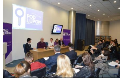
Predstavljanje izvještaja o posmatranju Opštih izbora 2014.

Koalicija 'Pod lupom' predstavila je u decembru na press konferenciji u Sarajevu svoj Finalni izvještaj o nestranačkom posmatranju Opštih izbora 2014. Izvještaj donosi rezultate nadgledanja sveukupnog ambijenta u BiH prije, tokom i nakon izbora, ali i preporuke za izmjenu izbornog zakonodavstva. Najveći dio preporuka se odnosi na