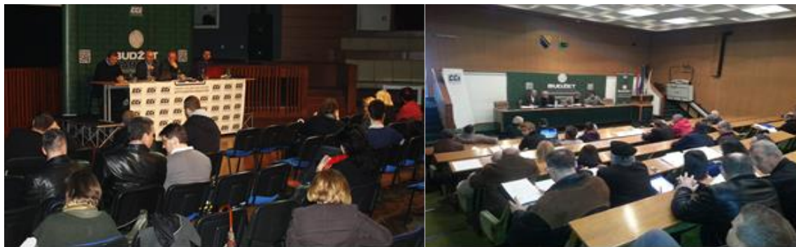
Javne rasprave o nacrtu budžeta za 2014. godinu – Kanton Sarajevo i Općina Zenica

U januaru 2014. godine CCI je uputio inicijative za reforme budžetskih politika na adrese Ministarstva finansija i trezora BiH, Parlamentarne skupštine BiH, Ministarstva finansija RS, Narodne skupštine RS, Ministarstva finansija FBiH, Parlamenta FBiH, te 10 kantonalnih ministarstava finansija i Brčko Distrikta. Fokus ciljanih reformi je veća participativnost građana u planiranju budžeta, veća transparentnost realizacije budžeta, te dosljedno poštovanje preporuka iz revizorskih izvještaja.