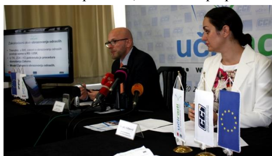
Predstavljanje kampanje, Sarajevo, juli 2014.

U prvoj polovini 2014.godine, CCI je zajedno sa partnerom na projektu ALDI, osigurao kompletiranje obuhvatne analize zatečenog stanja u oblasti obrazovanja odraslih sa osvrtom na EU politike i praksu. Iz ove analize proizišle su preporuke u formi Policy prijedloga, te još važnije, Model Zakona o obrazovanju odraslih za nivo kantona u Federaciji BiH. Početkom jula CCI je održao press konferenciju na kojoj su predstavljeni rezultati višemjesečne analize tržišta rada, strukture nezaposlenih, te šansi i prepreka za otvaranje novih radnih mjesta i jačanja tržišta rada putem brzih prekvalifikacija, obuka i obrazovanja odraslih. Istaknuta je važnost donošenja kantonalnih zakona o obrazovanju odraslih, koji će osigurati da svaki građanin BiH ima završenu barem osnovnu školu, ali jednako važno, ovi zakoni će osigurati brze prekvalifikacije, pomoć poslodavcima i nezaposlenima, te otvaranje novih radnih mjesta i samozapošljavanje.