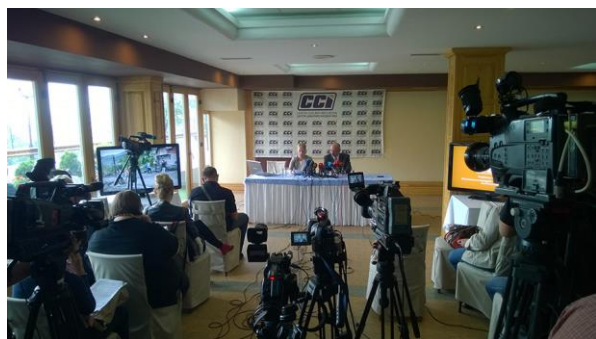
CCI pres konferencija, Sarajevo 2014.

Njegujući dobru praksu CCI je i tokom 2014. godine nastavio sa aktivnostima monitoringa rada izvršnih i zakonodavnih vlasti u BiH, na svim nivoima, objavljujući kvartalne, polugodišnje i godišnje izvještaje o radu vlasti u BiH. Tokom 2014. godine pripremljeno je preko 100 izvještaja o monitoringu. Posebno