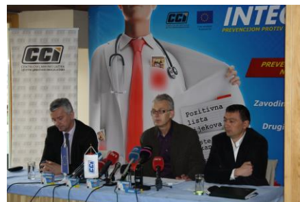
Pres konferencija, Sarajevo, mart 2014.

Projektno osoblje je u prvom tromjesečju 2014. godine pratilo, prikupilo i obradilo podatke o napretku u donošenju antikoruptivnih mjera u ciljnim institucijama javnog zdravstva u