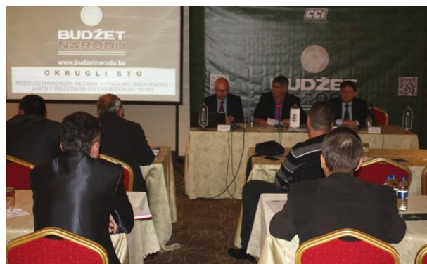
Okrugli sto u Banjaluci i konferencija: „Izazovi budžetske (ne)stabilnosti u BiH“, Banja Luka, Sarajevo, maj 2014.

Tokom aprila i maja, CCI je organizovao trostruku promociju dokumentarnog filma "Budžet narodu" u Brčkom, Banjaluci i Sarajevu. Film predstavlja polusatnu kompilacija intervjuua sa vodećim osobama u oblasti javnih finansija u BiH, ciljano provedenih u svrhu snimanja ovog filma, izjava građana na ovu