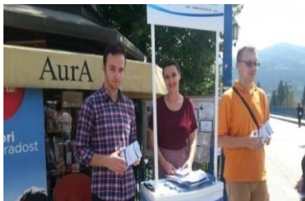
Ulični štand, Zenica, avgust 2014.

Paralelno s ovim aktivnostima, CCI je intenzivno zagovarao donošenje Zakona o obrazovanju odraslih tamo gdje je u ranoj fazi iskazana volja kantonalnih vlasti. Rezultat ovih aktivnosti jeste da je u Zeničko-dobojskom kantonu (ZDK) usvojen Zakon o obrazovanju odraslih, na sjednici Skupštine ZDK u avgustu 2014. U sklopu aktivnosti zagovaranja za donošenje Zakona u ZDK, CCI je organizovao ulični štand u