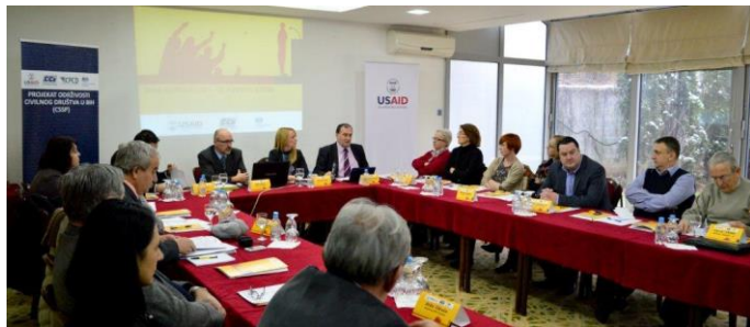
Predstavljanje analize „Javne rasprave u BiH – od forme ka suštini“, Sarajevo, 2015.

Analiza „Javne rasprave u BiH – od forme ka suštini“ je ukazala da javne rasprave, kao najpoznatiji vid uključenja javnosti u procese donošenja odluka, pokazuju koliko su javne institucije države otvorene prema građanima i u kojoj mjeri organizacije civilnog društva prihvataju kao partnere. Analiza je zasnovana na istraživanju postojećih akata zakonodavne i izvršne vlasti kojima je regulisano provođenje javnih rasprava, zatim povratnih informacija dobijenih iz ovih institucija i iskustava nevladinog sektora.