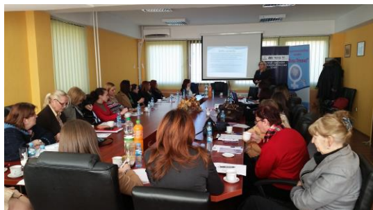
Sastanak članica mreže Womennet, Zvornik, 2014.

Nakon održanih treninga i odobrenih projektnih prijedloga organizacije su počele sa kreiranjem mreža iz 12 sektora. Sektorske mreže su kroz široke konsultacije sa građanima i različitim interesnim grupama 2