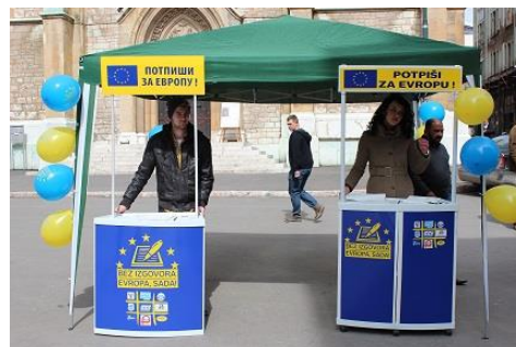
Promotivni štand u Sarajevu, mart 2014.

Putem ove kampanje omogućeno je građanima BiH da svojim potpisom podrže ubrzanje procesa integracija BiH u Evropsku uniju. Kampanja je građanima BiH pružila alat kojim će dići svoj glas protiv zastoja ovog procesa i zahtijevati konkretne akcije svojih izabranih predstavnika ka ubrzanju evrointegracija BiH.