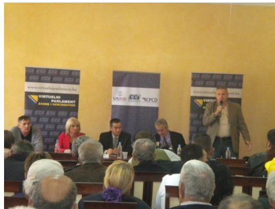
Javna tribina u Drvaru, oktobar 2013.

Sve javne tribine snimljene su od strane TV ekipe CCI-a, a snimljeni materijal se koristio za izradu TV emisija u trajanju od 30 minuta, koje je emitovao javni servis BHT.