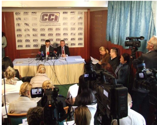
Pres konferencija, Sarajevo, 28. oktobar 2013.

Tokom posljednje godine implementacije projekta CAPP II, CCI je nastavio monitoring rada vlada i parlamenata u BiH i objavio godišnje izvještaje o radu vlada i parlamenata za 2012. godinu, potom kvartalne i šestomjesečne za 2013. U 2013. godini objavljeno je približno 100 izvještaja o monitoringu rada vlasti koji su predstavljeni putem 50 pres konferencija. Do avgusta 2013. godine, prikupljene su i analizirane informacije sa preko 700 sjednica izvršne i zakonodavne vlasti, dok su predstavnici CCI-ja direktnim prisustvom nadgledali 200 sjednica. Monitoring je obuhvatio rad 136 ministarstava i 220 odbora i drugih parlamentarnih tijela, te preko 760 javnih zvaničnika (parlamentaraca i ministara).