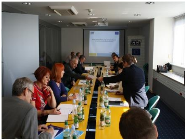
Sastanak Radne grupe, Sarajevo, 24. oktobar 2013.

Također, oko polovina ukupno anketiranih građana smatra da su najvažnije mjere, koje treba preduzeti u borbi protiv korupcij uvođenje strožijih sankcija zaposlenim u zdravstvu za koruptivno ponašanje, kao i uvođenje kontrolnih i mjera nadzora u svim zdravstvenim institucijama. Tokom 2013. godine, održan je i prvi sastanak sa rukovodstvom Agencije za prevenciju korupcije i borbu protiv korupcije, te dogovoren nacrt memoranduma o saradnji. Formirana je Radna grupa koju su čine delegirane osobe iz ciljnih institucija zdravstva, APIK-a, CCI i 3 druga NVO-a. Kao rezultat aktivnosti Radne grupe, kreiran je i nacrt plana integriteta u skladu sa tačkom 2.14. Akcionog plana za provođenje Strategije za borbu protiv korupcije u BiH.