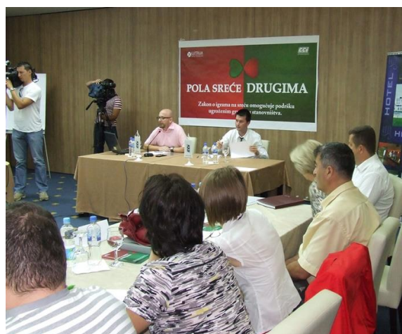
Okrugli stol, Sarajevo, juli 2013.

Naime, već krajem 2012. godine, na inicijativu CCI-a, formirana je mješovita Radna grupa u čiji sastav su ušli predstavnici CCI, Ministarstva finansija FBiH, organizacija osoba s invaliditetom, priređivača igara na sreću, Lutrije BiH, te Poreska uprave, s ciljem pripreme novog teksta Zakona o igrama na sreću FBiH, te su stvorene pretpostavke za pokretanje kampanje zagovaranja.