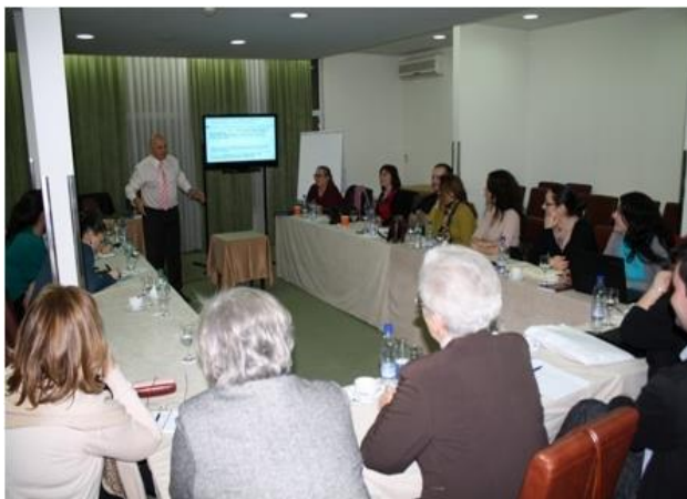
Poreska problematika u NVO sektoru, april 2013.

U oblasti jačanja kapaciteta organizacija civilnog društva, CCI je tokom 2013 godine organizovao 7 treninga i jedno studijsko putovanje u Slovačku. Moduli treninga zasnivali su se na zahtjevima koji su pristizali iz partnerskih organizacija civilnog društva, te na evaluacijama treninga održanih u prethodnom periodu. Radi se o treninzima iz oblasti upravljanja projektima (monitoring i evaluacija, dizajniranje i upravljanje EU projektima, izazovi menadžerskog zanata, upravljanje vremenom), te treninzi javno zagovaranje i porezi i poreska problematika u NVO sektoru.