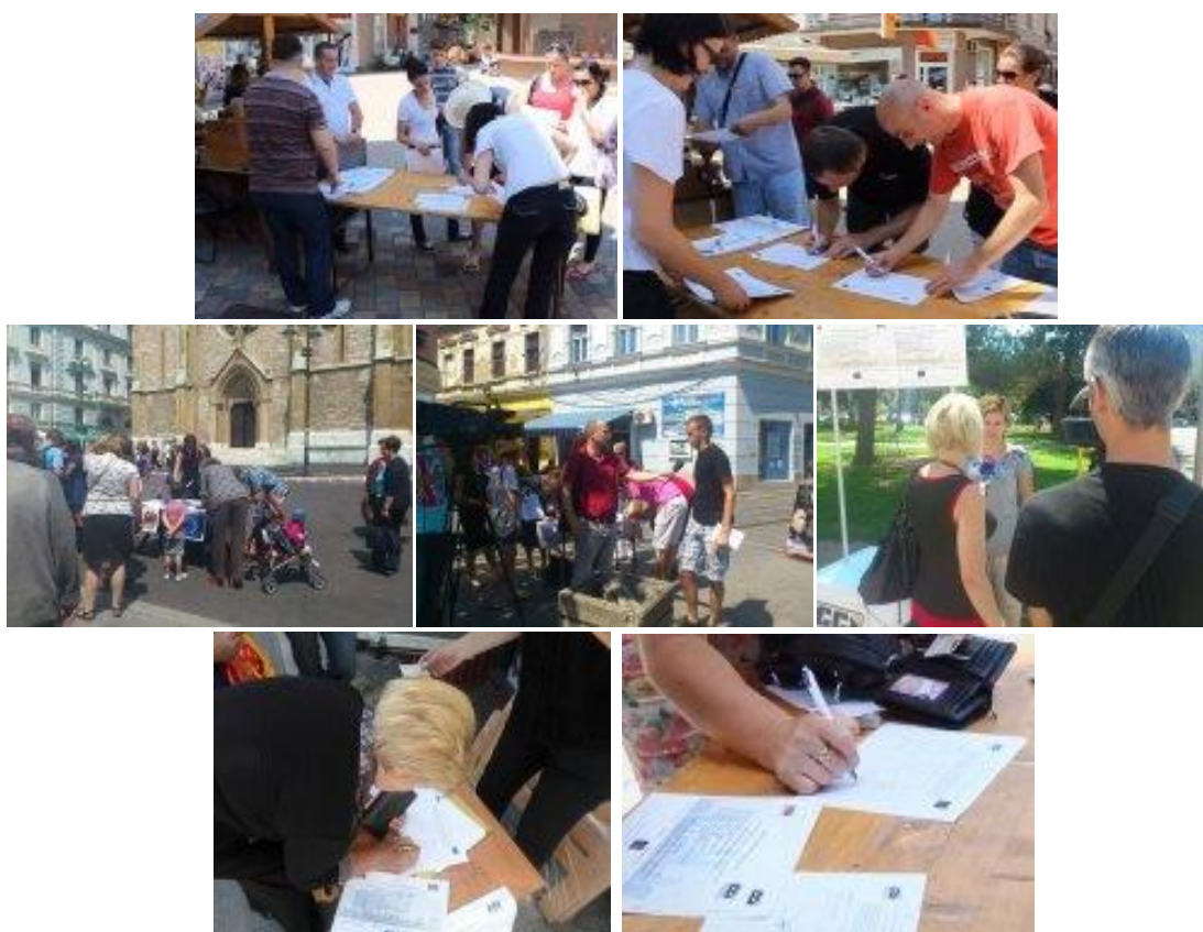
Potpisivanje peticije u Bihaću, Sarajevu, Tuzli, Livnu, Bosanskom Petrovcu, maj/juni 2013.

U cilju informisanja javnosti, CCI i partnerska organizacija organizovali su 15 štandova u 15 gradova i opština u BiH. Na štandovima u FBiH organizovano je i potpisivanje peticije za izmjene Zakona o principima lokalne samouprave, te i online potpisivanje peticije.