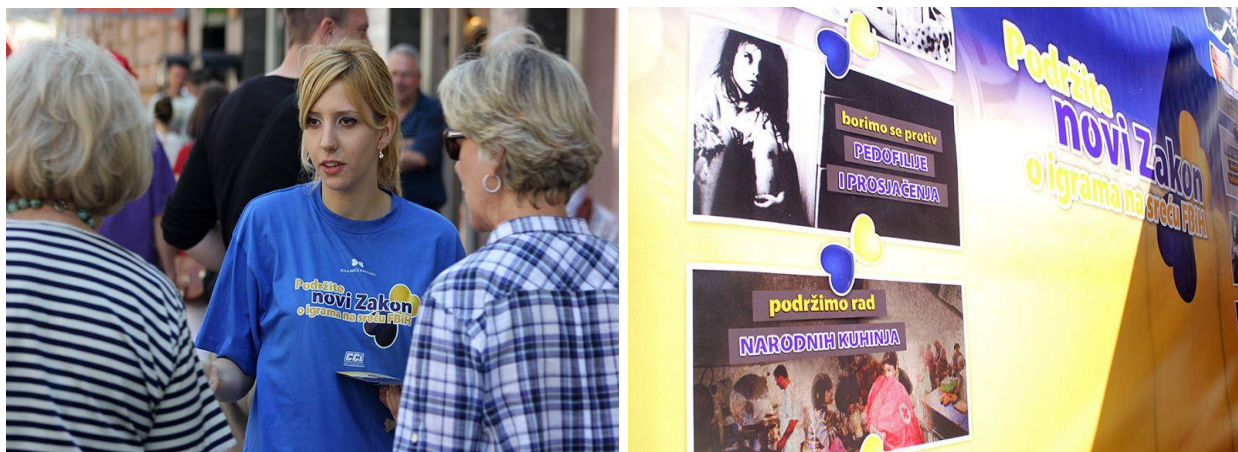
Ulična akcija u Sarajevu, juni 2013.

Tokom ovog perioda CCI je organizovao centralnu konferenciju tokom koje je razmatran usvojeni Nacrt Zakona, te su data mišljenja niza stakeholdera.