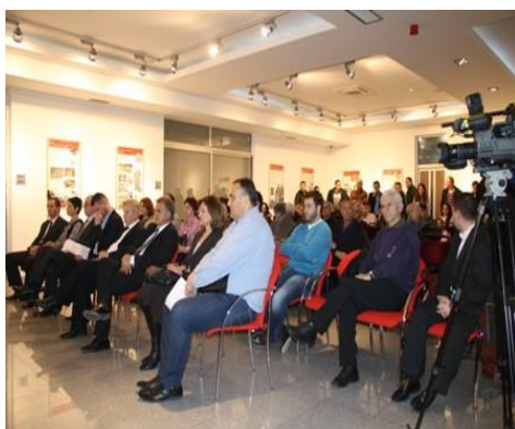
Forum odgovornosti u Bijeljini, mart 2013.

Kvalitet života je ključni koncept koji posljednjih godina ima sve veći značaj u području društvenih nauka. Zbog sveobuhvatne prirode, kvalitet života uzima u obzir objektivne uslove u kojima ljudi žive kao i subjektivnu ocjenu koju pojedinci donose o materijalnim sredstvima koja su im na raspolaganju zajedno sa njihovim stavovima prema društvu i perspektivom kvaliteta tog društva. Ciljevi koje je CCI postavio u ovom segmentu odnose se na unaprjeđivanje rada lokalnih vlasti, posebno načelnika opština i lokalne administracije, a u pravcu poboljšanja kvaliteta života građana u 14 6 ciljnih opština i gradova u BiH, kroz primjenu različitih