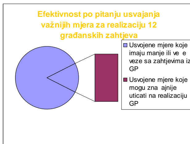
Dijagram 3: Efektivnost VM po pitanju usvajanja važnijih razvojnih mjera za realizaciju zahtjeva iz GP. Od preko 130 mjera koje imaju manje ili veće veze sa zahtjevima iz GP, samo 20 dugoročno može uticati na realizaciju građanskih zahtjeva.

U skladu sa pokazateljima za polugodišnji period možemo zaključiti da ako se nastavi ovakav trend u radu Vijeća ministara, prilikom donošenja mjera koje bi trebale uticati na rješavanje ključnih građanskih problema, za očekivati je da ne ćemo imati veliki broj značajnijih mjera ni veće efekte po pitanju donošenja razvojnih i kvalitetnih mjera za realizaciju ključnih zahtjeva građana ove zemlje, kojima je cilj poboljšanje opšte kvalitete života.